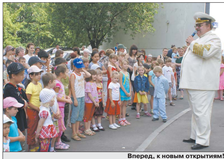
Вперед, к новым открытиям!