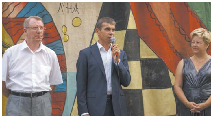
Директор центра принимает поздравления

В первый день рождения решено было устроить большой праздник для всех семей района. Задолго до начала официальных торжеств на площади, перед зданием центра, открылся шатер театра ростовых кукол «Балаган». Дети с удовольствием играли с плюшевыми героями любимых мультфильмов, участвовали в конкурсах и спортивных состязаниях.