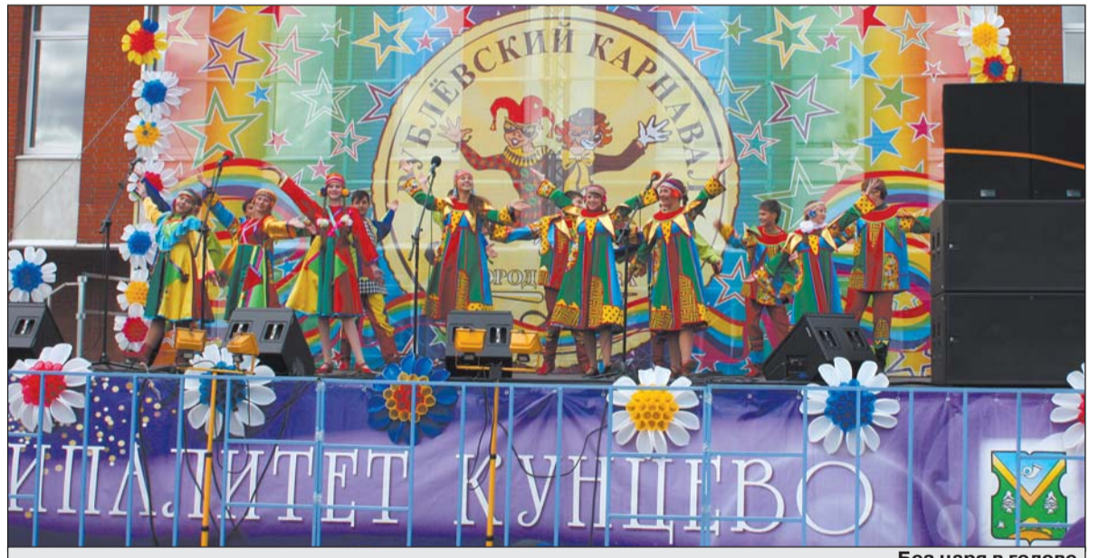
Без царя в голове