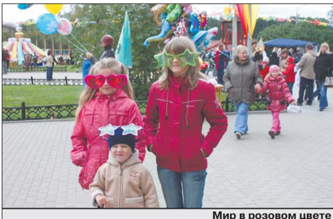
Мир в розовом цвете