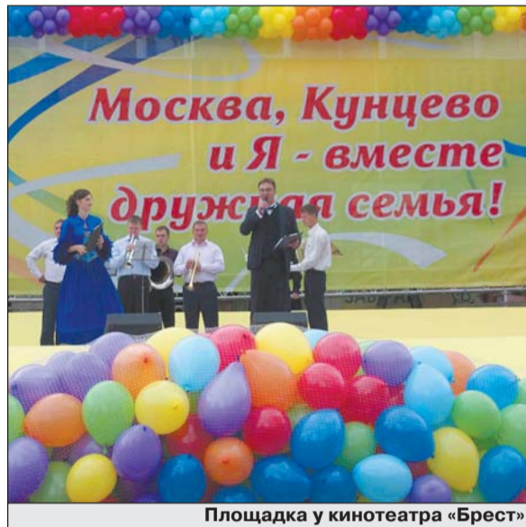
Площадка у кинотеатра «Брест»