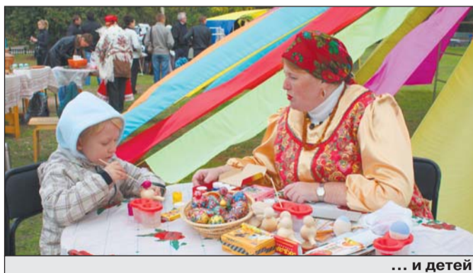
... и детей