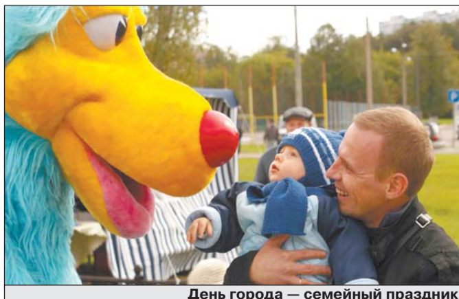
День города — семейный праздник