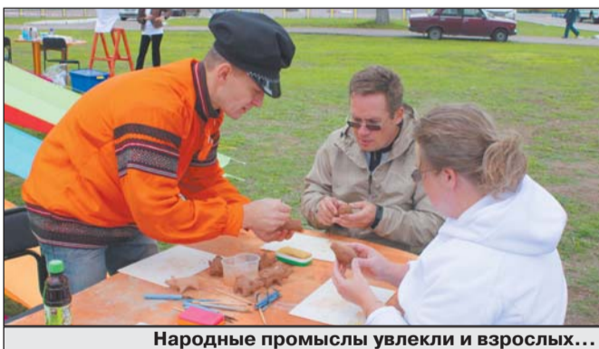
Народные промыслы увлекли и взрослых...