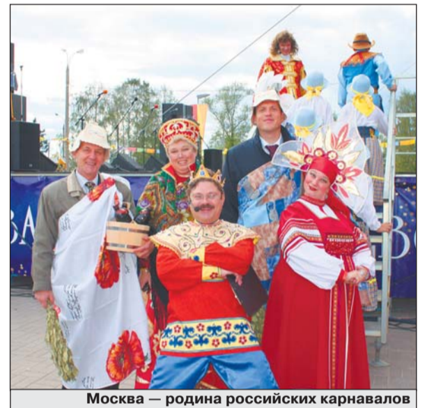
Москва — родина российских карнавалов