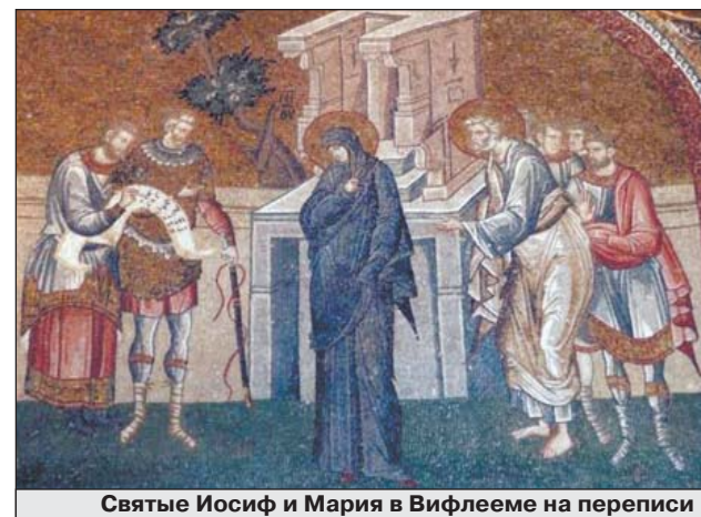
Святые Иосиф и Мария в Вифлееме на переписи

В эпоху раннего Средневековья практиковались эпизодические учеты населения — в фискальных (служащих интересам казны) целях или по иным обстоятельствам. Например, известно, что в 1085—1086 гг. численность населения Англии составляла около 2,5 млн человек. Вильгельм Завоеватель, по приказу которого был проведен учет жителей 34 графств, назвал свод полученных материалов Книгой Страшного суда (Domesday Book) с намеком на библейский Судный день, когда каждому предьявят полный список его деяний. Этот фолиант — беспрецедент-