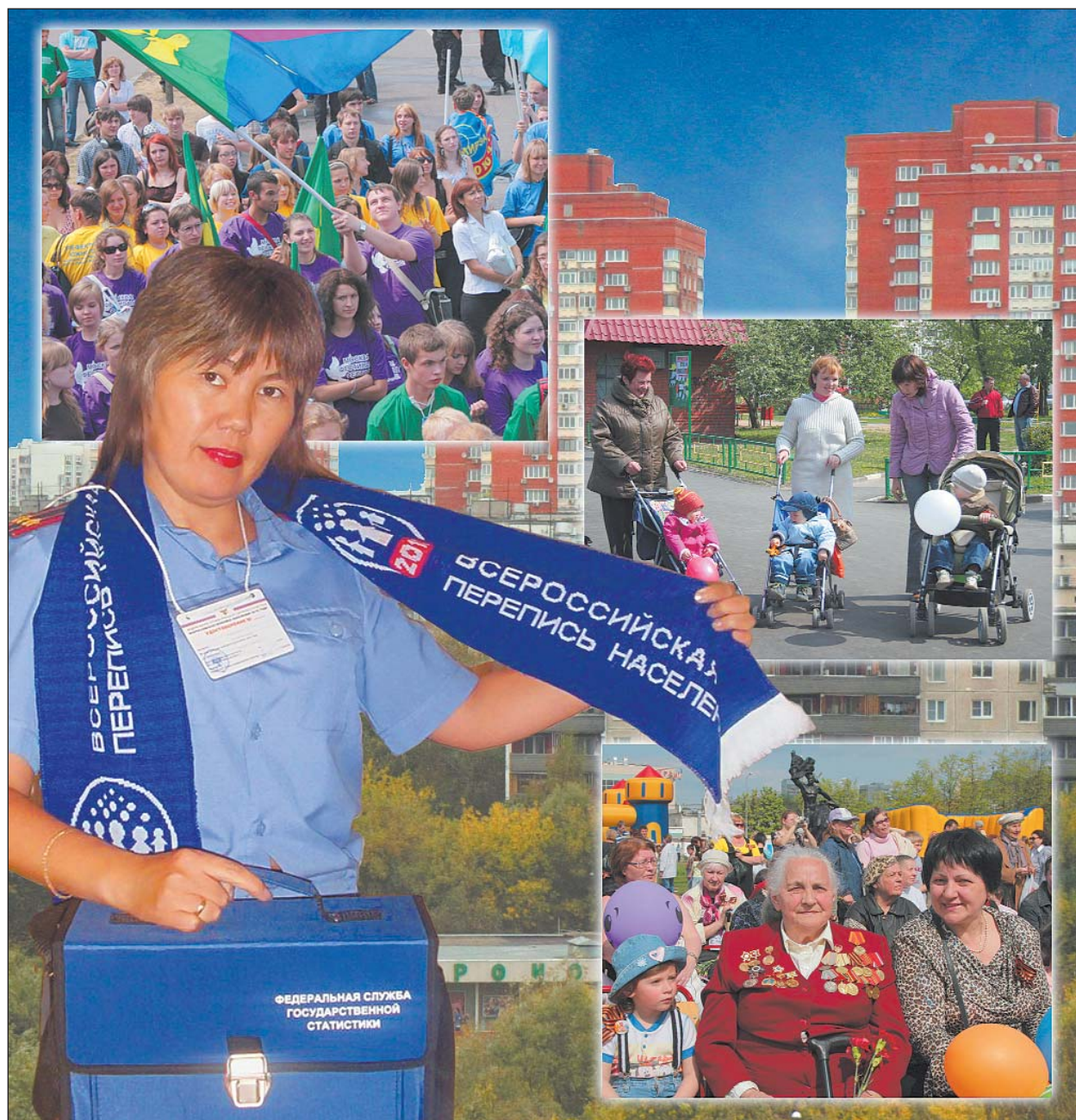
Коллаж: Римма Егорова