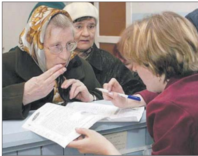
Индивидуальные приборы водоучета позволяют экономить до 40 % стоимости коммунальных услуг

Установка квартирного прибора учета водопотребления значительно снижает коммунальные платежи. В многоквартирных домах жильцы могут устанавливать счетчики, обратившись в службу «одного окна» ГУ ИС своего района. При использовании счетчика воды можно ежемесячно сэкономить до 30 %. В этом случае жилец платит только за фактически израсходованный объем воды, а сумма не зависит от количества проживающих. Поэтому такой вариант выгоден, если в квартире живут меньше человек, чем прописаны. Помните, что практически все многоквартирные дома оборудованы общедомовыми приборами учета и весь объем израсходованной воды пропорционально делится на всех жильцов. Во-первых, с личным счетчиком вы