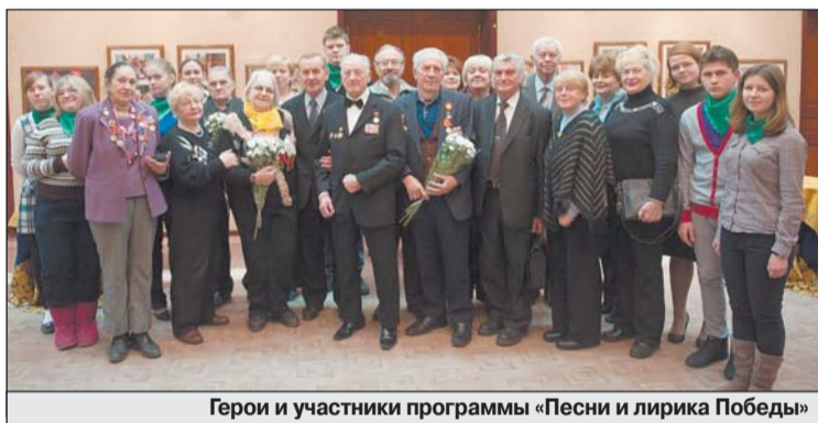
Герои и участники программы «Песни и лирика Победы»