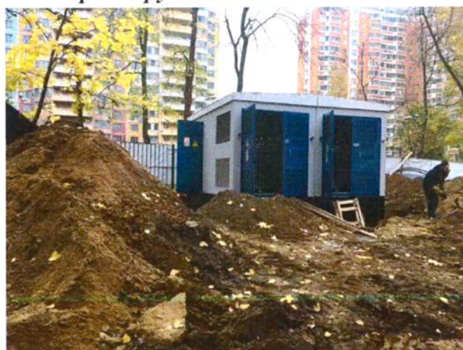
Новый трансформаторный пункт