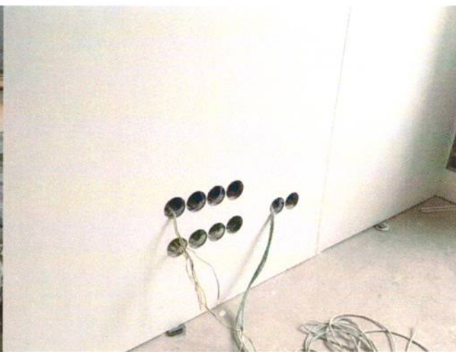
Обеспечение достаточного запаса источников питания