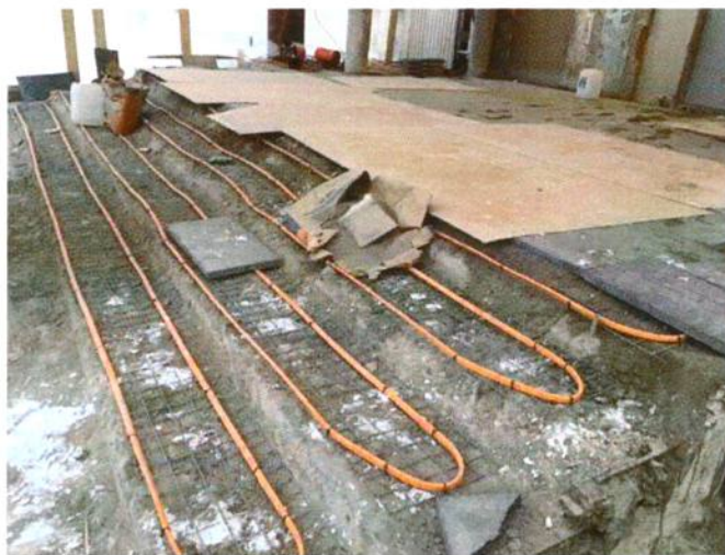
Отопление крыльца – защита от наледи