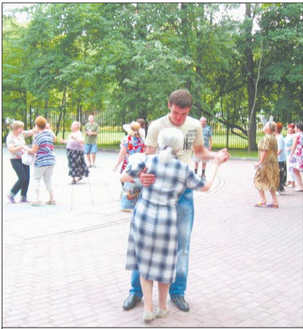
В вальсе кружились и стар и млад

Аномально жаркое лето превратило Москва-реку в южное море, а пос. Рублево во всемосковскую здравницу, куда в выходные потянулись тысячи курортников одного дня. А какой же курортный город без парка развлечений?