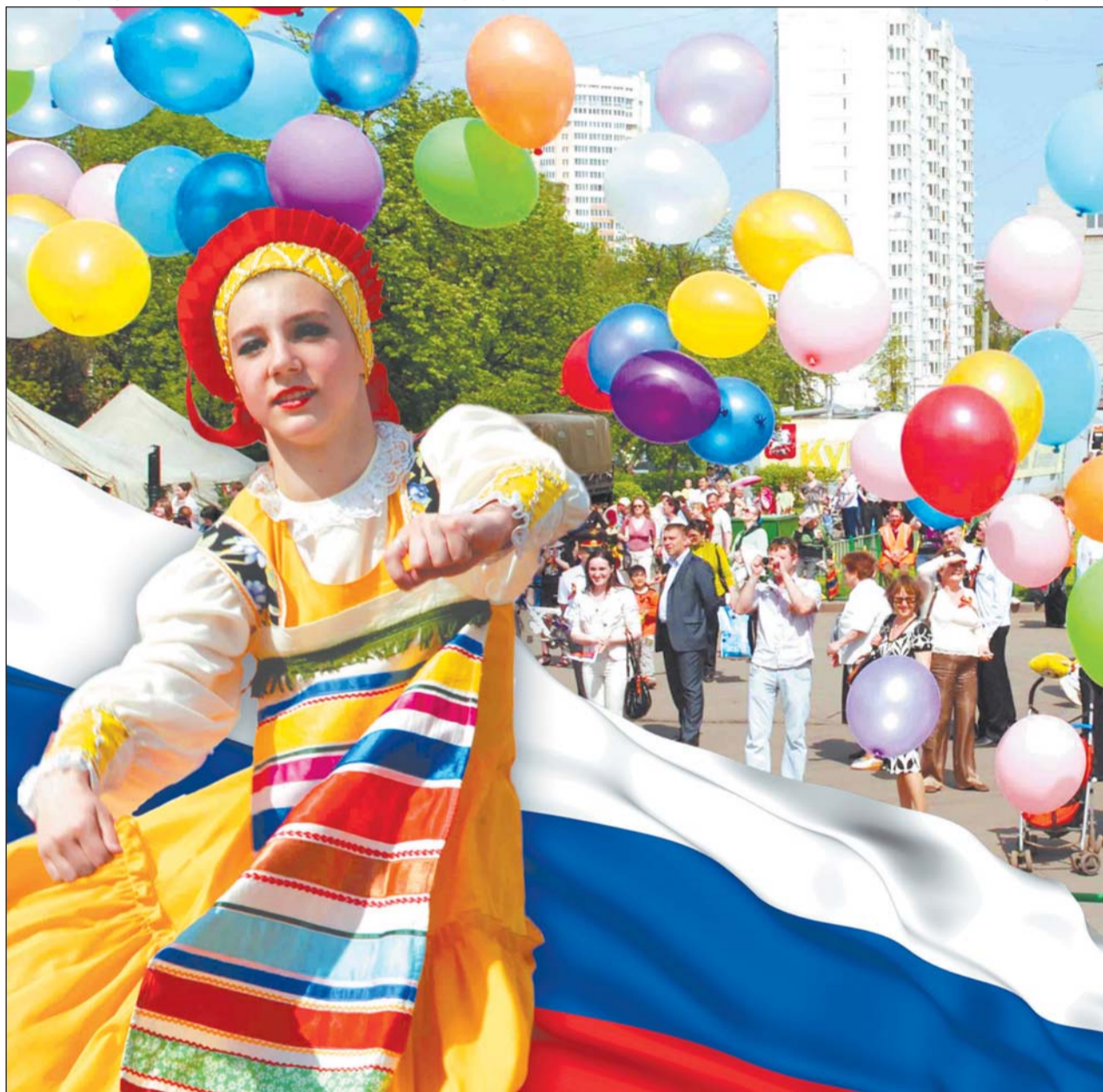
Коллаж: Римма Егорова