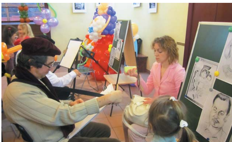
Праздник для мам