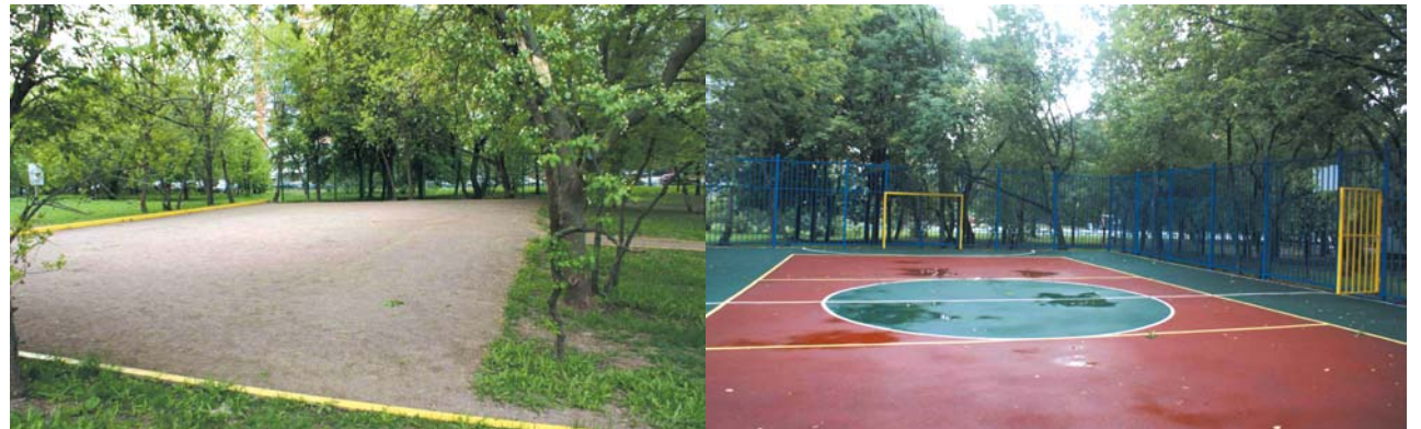
Ул. Полоцкая. Спортивная площадка до и после ремонта территории района Кунцево на 2012-2016 гг.

- смотр-конкурс концертных номеров "Созвездие Кунцево" среди учащихся общеобразовательных учреждений; - торжественное мероприятие, посвященное 70-ой годовщине битвы за Москву для ветеранов Великой Отечественной войны.